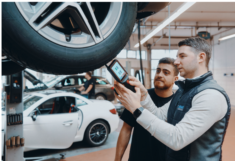
IMAK – Die Werkstattmacher präsentiert sich als deutschlandweiter Partner rund um das Thema Werkstattausrüstung, wozu seit Kurzem etwa auch das laserbasierte Handmessgerät Reifeninspektor gehört