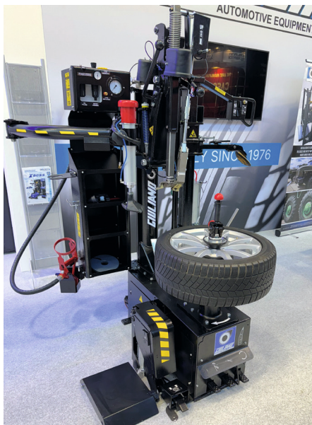
Seit 2023 ist IMAK deutscher Generalimporteur der Marke Giuliano; Giuliano Automotive aus Italien gehört seit über 40 Jahren zu den etablierten Anbietern von Reifenservicegeräten

IMAK versteht sich dementsprechend als Komplettanbieter und möchte die von dem Unternehmen erkannte Lücke „mit nationaler Abdeckung schließen“, so der Geschäftsführer. Dabei reiche das Produktportfolio vom kleinen Handwerkzeug in der Pkw-Werkstatt bis zur Mehrstempelanlage für Nutzfahrzeuge.